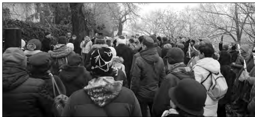
Tömeg a fagyban

Hogy egyszer majd felvessik falára a próféta mondatot: