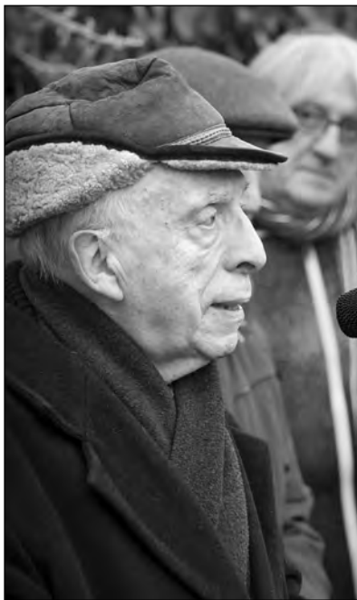
A remény, hogy egyszer talán majd kiássák

Péntek délután érkeztem – középkori látvány és hangulat fogadott. Alighogy kicsomagoltam, megszólalt a sziréna. Túlélőként csomagomhoz kaptam, hogy az óvóhelyre menjek. Megfogták a karomat: ülj vissza nyugodtan, bejött a sábesz.