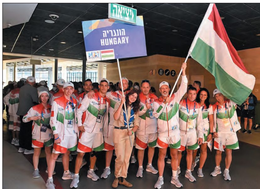
A magyar csapat tagjai a 21. Maccabiah megnyitóján